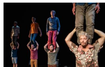
Carrying my father | There Company zo 19.12.21 | 20u30 Cc Strombeek