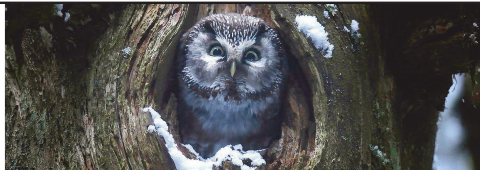
Een uil, herten in de mist en vader Michel in het bos: in Le chant des forêts observeert Vincent Munier samen met zijn vader en zoon de dieren van de Vogezen.

Die ecologische insteek geeft een extra lading aan natuurdocumentaires: door natuurpracht te tonen, illustreren ze ook wat we door de klimaatcrisis dreigen te verliezen. "De natuur is niet enkel een spektakel, het is boven alles een gedeeld leven", zo begint de aftiteling van Le chant des forêts , waarmee de film ook oproept tot verantwoordelijkheid bij zijn kijkers. "Het is nooit beschuldigend, maar via ver-