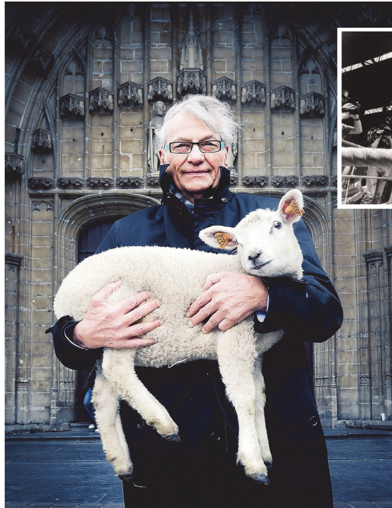
Jan Hoet was de ideale man om kunst te populariseren, al genoot hij gaandeweg iets te veel van zijn BV-status.

Met zijn charisma en humor was Hoet jarenlang de ideale man om kunst te populariseren, al genoot hij gaandeweg ook wel iets te veel van zijn BV-status. Als curator-directeur gaf hij jonge kunstenaars als Fabre of Wim Delvoye bovendien een enorme duw in de rug, terwijl hij jarenlang vocht voor het S.M.A.K. in Gent, een museum dat er een kwarteeuw later nog