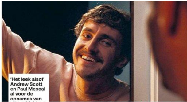
'Het leek alsof Andrew Scott en Paul Mescal al voor de opnames van elkaar hielden.'