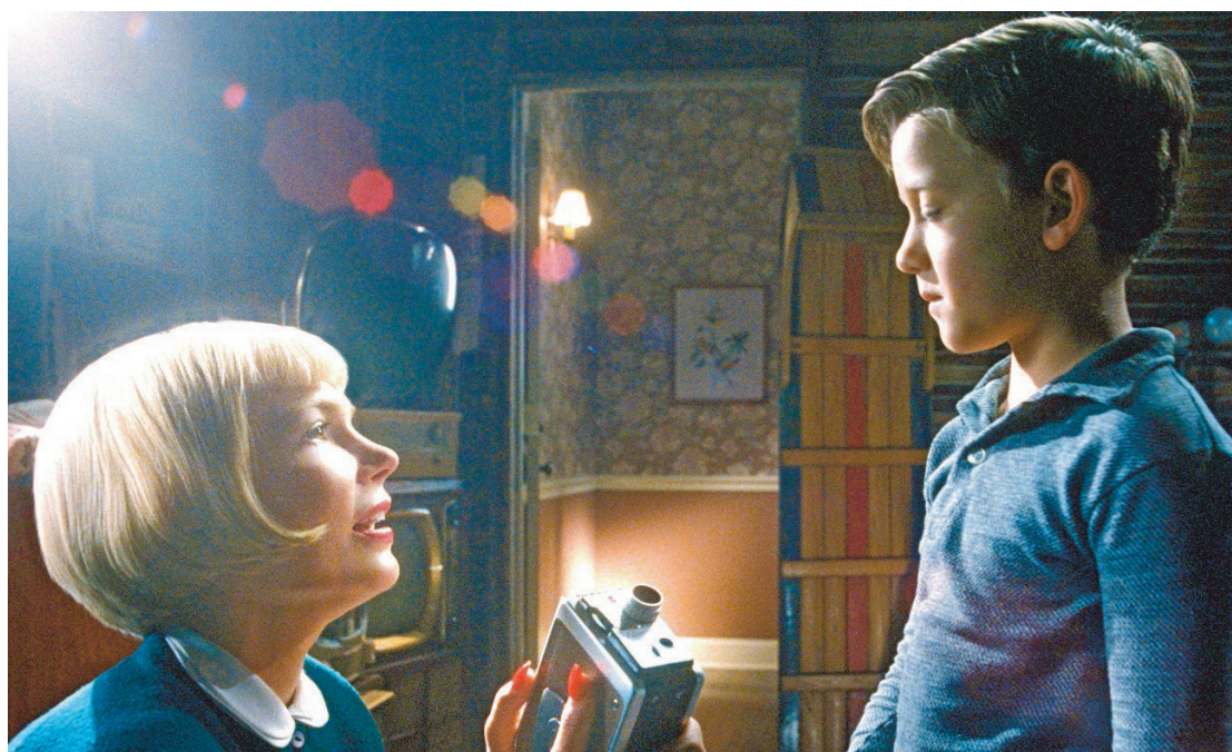
Michelle Williams als moeder Mitzi Fabelman en Mateo Zoryan Francis-DeFord als de jongste Sammy Fabelman.

The Fabelmans , vanaf woensdag 22/2 in de cinema.