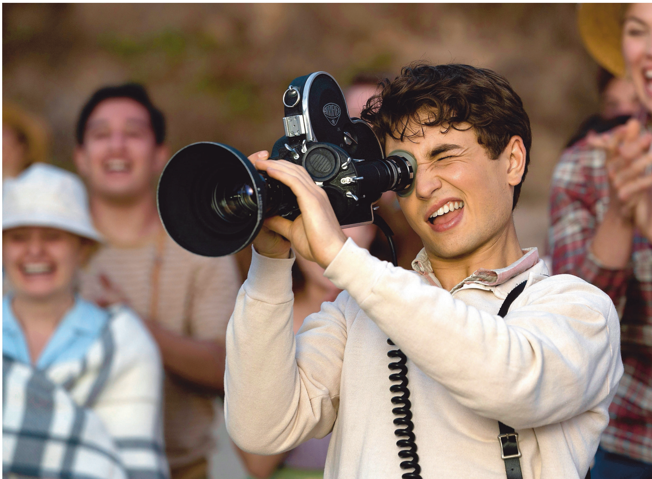
Gabriel LaBelle als Sammy Fabelman – zeg maar de jonge Steven Spielberg – in The Fabelmans.

Met 'The Fabelmans' keert gevierd regisseur zijn hele autobiografische boodschappenmand om