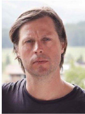
Felix Van Groeningen

‘Voor ‘Beautiful Boy’ (zijn film uit 2018, red.) zat ik een jaar in Amerika. Ik moet me onderdompelen in een plek. Natuurlijk was dit een hele nieuwe wereld. Ik kende Luca en Alessandro (Marinelli en Borghi, de hoofdrolspelers, red.) niet. Ze waren gecast door het productieteam, niet toevallig, het zijn de twee grote namen van hun generatie. Maar ze waren wel gecast voor de andere