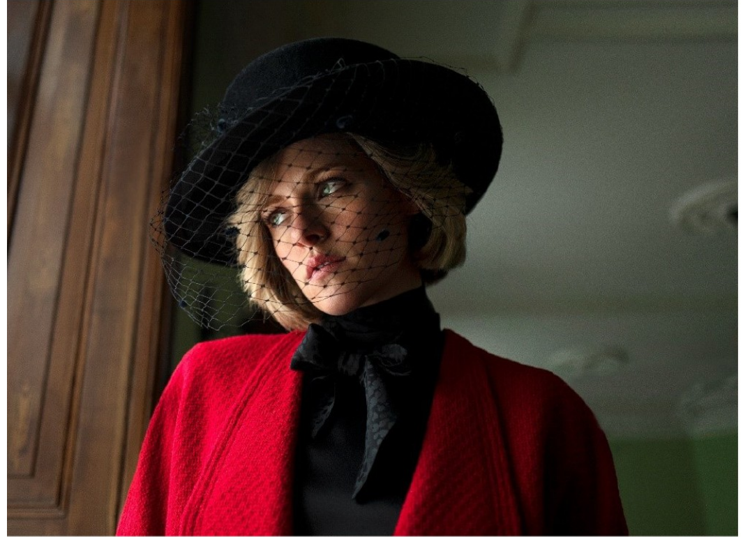
Kristen Stewart als Diana Spencer: ze verdient een Oscar.

Spencer lijkt dan ook een soort gevangenisfilm: Diana moet ontsnappen. Alleen zijn er geen tralies: ze zou er simpelweg vandoor kunnen rijden met haar Porsche. In werkelijkheid is het toch iets complexer, om nog te zwijgen van haar twee zonen, met wie ze enkele mooie momenten deelt. Het is