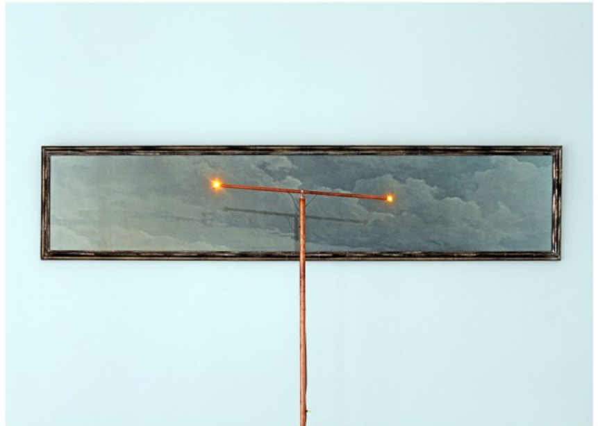
'L'androgynie, 1. Avion en phase d'approche, 1986-2013'.