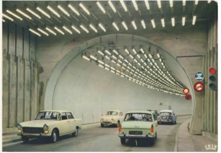
'Les péripéties' (2014-2017): 'L'exception' van René Magritte (1963) en 'Chamonix - Mont Blanc, Tunnel du Mont Blanc', twee ansichtkaarten.

laatste moment voegde ze er een projectie van Mickey Mouse-filmpjes aan toe. Gewoon, omdat haar dat hier en nu het best leek te passen.