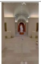
Het Louvre vanuit je huis.

Volgens Sophie Grange van de communicatiedienst leidt 'het huwelijk van smartphone en sociale media' tot de triomf van het virtuele beeld. De grote musea kunnen volgens haar niet anders dan de digitale platformen zo goed mogelijk uitbouwen. Het Louvre haalde in 2019 een record van 14,1 miljoen reële bezoekers. (gvds)