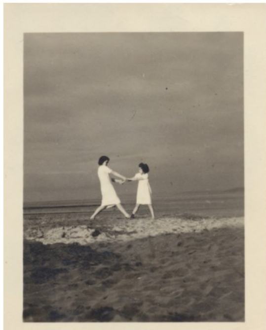
'Peggy & J.M.' © Jacqueline Mesmaeker

De installatie La serre de Charlotte et Maximilien uit 1977 was dan weer verloren gegaan. Om de glazen constructie uit serreglas en bamboe toch te kunnen tonen, herdacht Mesmaeker ze. Op het